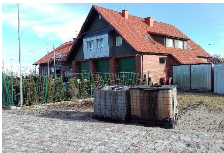
CTL Północ z Gdyni odbiór wód zaolejonych